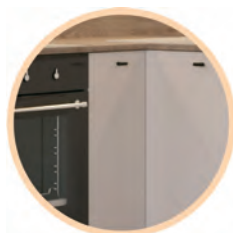
Zabudowa kuchenna z płyt Kronospan 18 mm – 5981 BS Cashmere; Sprzęt AGD Electrolux