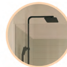
Deszczownica z baterią prysznicową DEANTE ANEMON