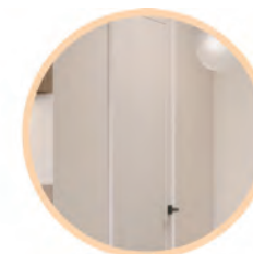
Drzwi wewnętrzne Erkado