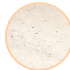
Gres szklony CORSO grey mat 60 x 60 cm