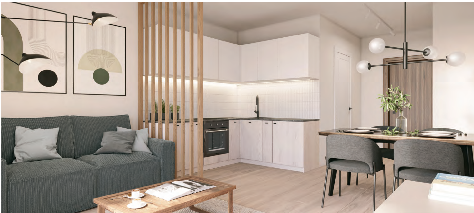
SCANDI – Pakiet Comfort, 27,21 m 2