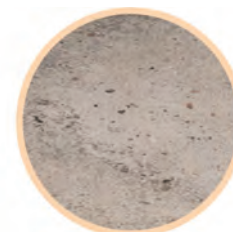
Gres szliwiony CORSO grey mat 60 x 60 cm