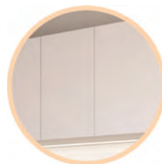
Zabudowa kuchenna z płyt Kronospan 18 mm – Snow White 8685 BS; z podświetleniem LED