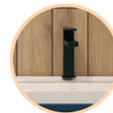
Bateria umywalkowa DEANTE ANEMON