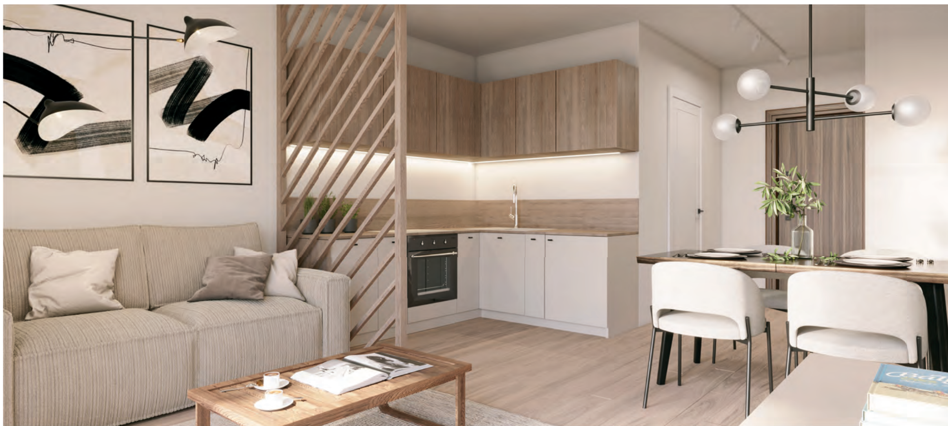
SCANDI – Pakiet Comfort, 27,21 m 2