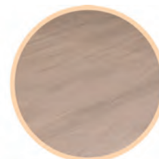
Panele wodoodporne SPC Rocko R066