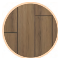
Gres szkliony SANDWOOD brown mat 18,5 x 59,8 cm