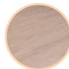
Panele wodoodporne SPC Rocko R077